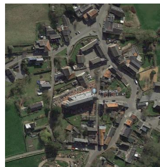
Soiron vu du ciel, Google Earth, 2020.