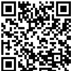
Petite histoire du carnaval, par Lumni.fr , consulté le 18 mars 2024.