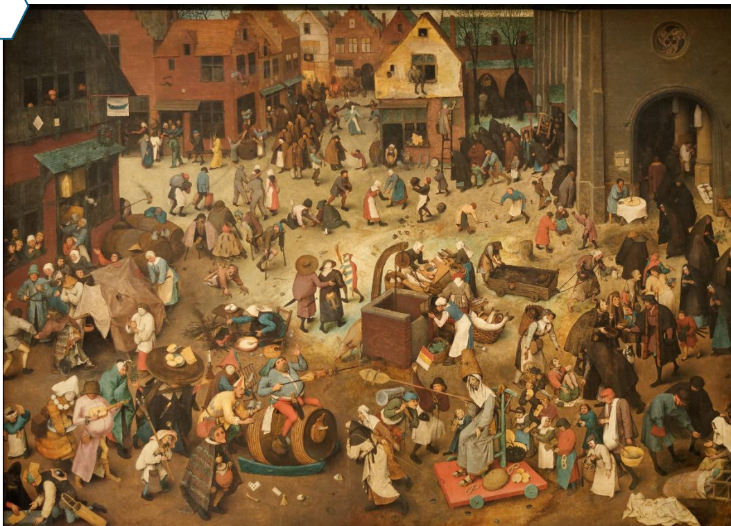
Pierre Brueghel l'Ancien, Le combat de Carnaval et de Carême , peinture sur huile (119x164,5cm), 1559.