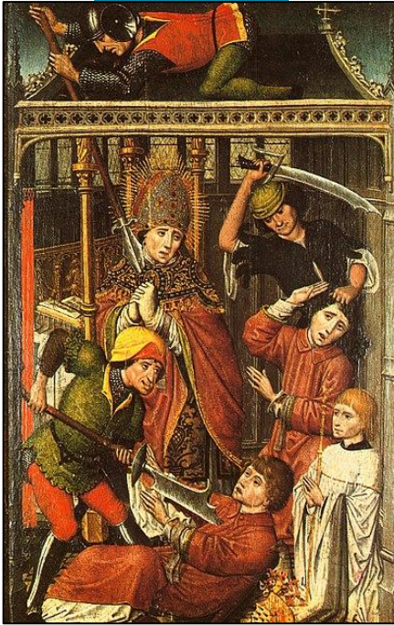
Martyre de Saint Lambert, partie du diptyque d'Henri ex Palude, attribué à Jan van Brussel (Jean de Bruxelles) https://fr.m.wikipedia.org/wiki/Fichier:St-Lambert-Li%C3%A8ge.jpg , consulté le 30 octobre 2024