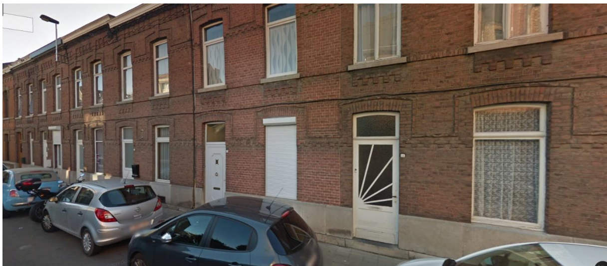
3. Rue Wouters, Andenne – maisons des années 1930