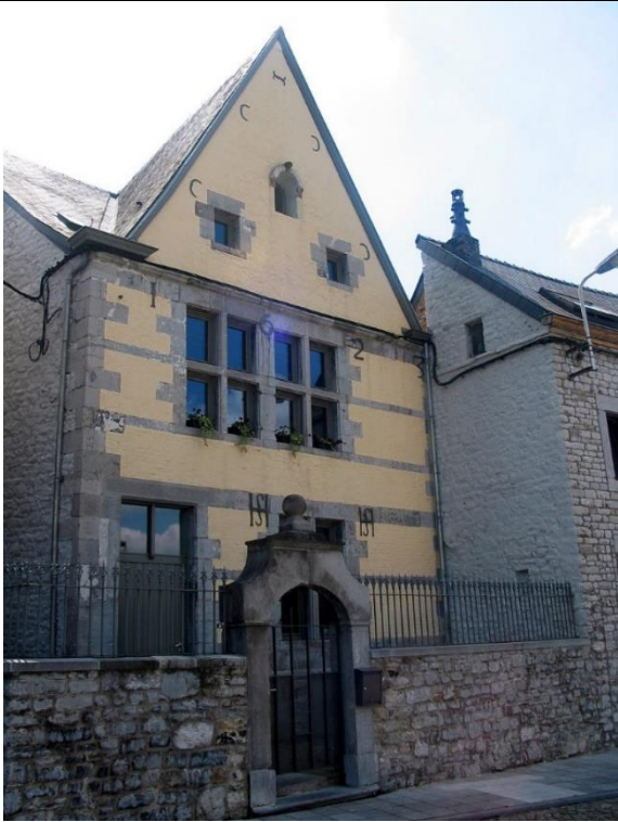
4. Maison dite « de Sainte-Begge », 1623