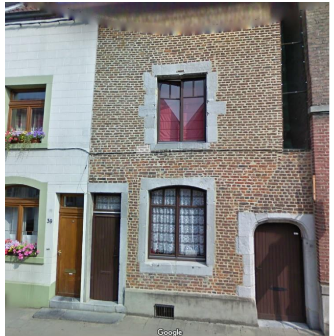
5. Rue Lapierre 41, maison du XVII e siècle. Google Maps 2009