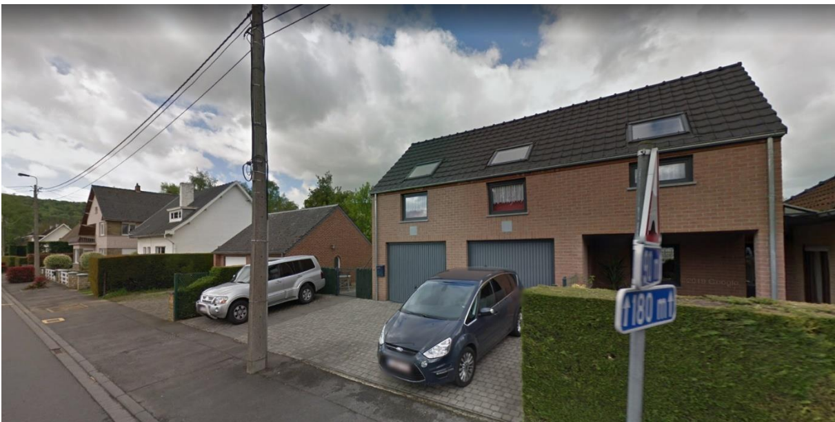
2. Rue de Gotte, Andenne, maisons des années 1980/2000/ Google Maps 2018

Source : Annales des travaux publics , tome 13, 1853-1854, pl. VI)