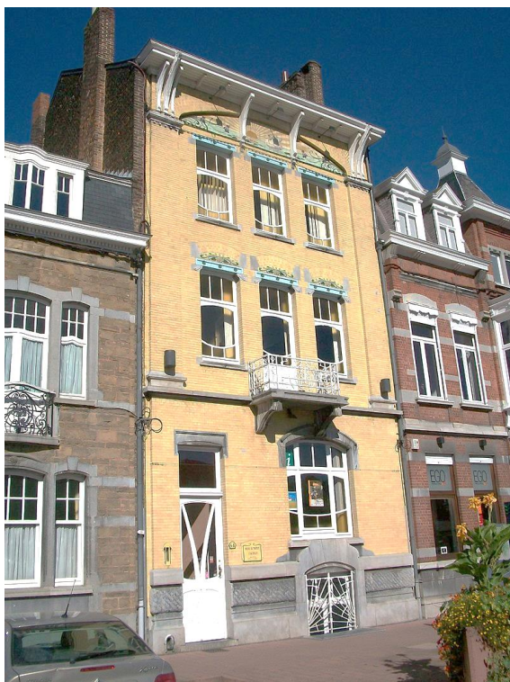
6. Place des Tilleuls 48, construction de 1907, maison Art Nouveau