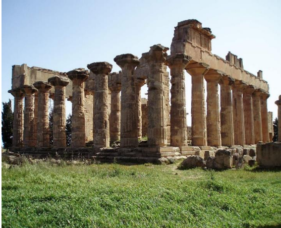
Les Ruines du temple de Zeus à Cyrène

https://fr.wikipedia.org/wiki/Cyr%C3%A8ne#/media/Fichier:Temple_of_Zeus_Cyrene.jpg , consulté le 12 mars 2021